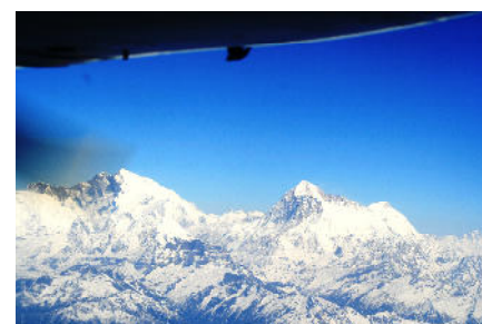
Il monte Everest dall'aereo